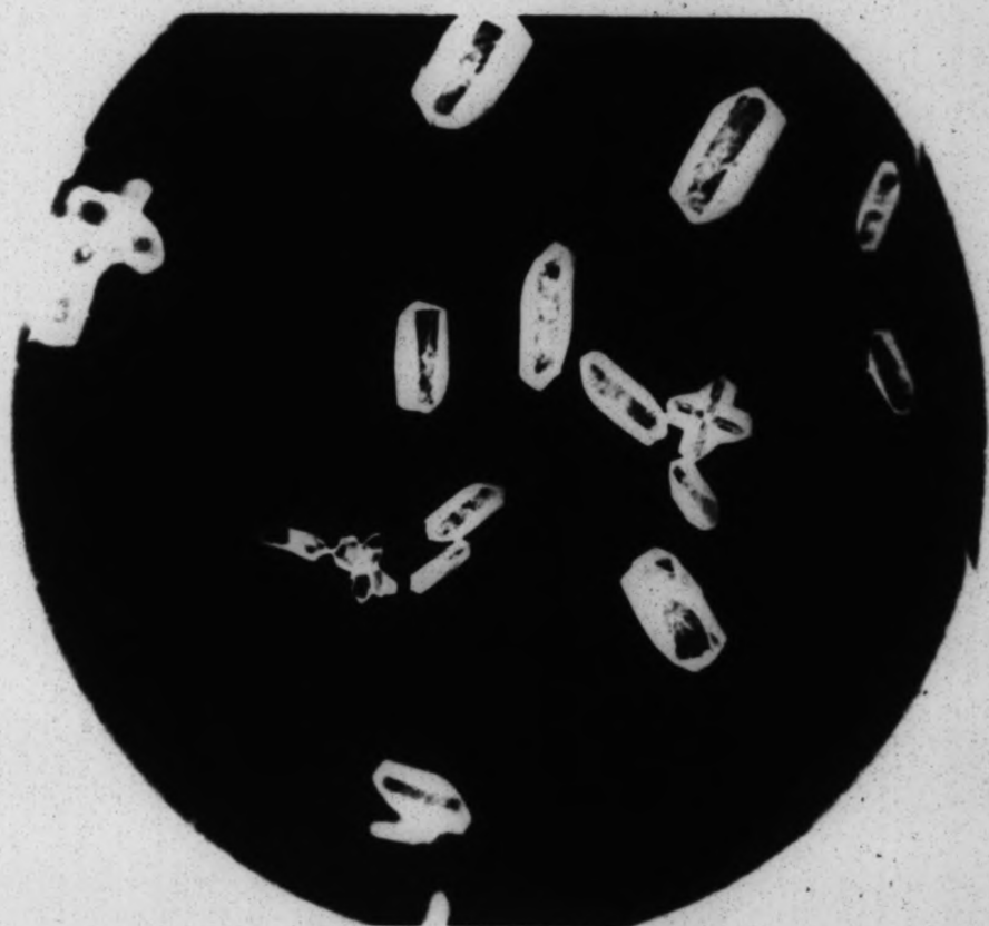
Hemibilirubin bei langsamer Krystallisation